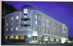
Radisson SAS Palace in Spa, België

vinden die een goede mix bieden, niet alleen qua behandelmogelijkheden en comfort, maar ook qua natuur, qua sfeer ook. Het moet iets extra's bieden waarvoor je er naartoe wilt reizen. Het moet het beste uit dat land tonen: sauna in Lapland, ayurveda in Sri Lanka, detox in Thailand, thalasso op Malta. Op elk van die plekken betekent wellness iets anders: in het ene land gaat het om luxe, in het andere om zen. In Lapland wandel je na je saunabezoek tussen de margrietten door naar het meer om af te koelen. Daar heeft wellness alles te maken met dichtbij de natuur zijn, heel basic. In het verre oosten betekent wellness óók: een mooie zonsopgang, gezond voedsel, vriendelijke en gastvrije mensen. In alle gevallen staat wellness voor: terugkeren naar jezelf. Er zit iets van persoonlijke groei in. Rust in je lijf, maar vooral ook in je hoofd. >