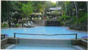
Hotel Ayurveda in Sri Lanka