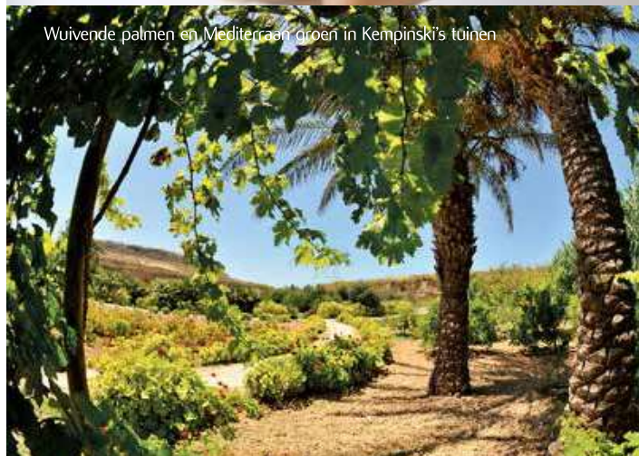
Wuivende palmen en Midderraan groen in Kempinski's tuinen